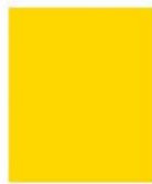
PMS Pantone Yellow