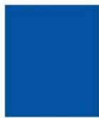
PMS Reflex Blue